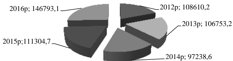
Рис. 2. Освоєння капітальних інвестицій за рахунок власних коштів підприємств та організацій, млн. грн.

Головним джерелом фінансування даної вибірки стали власні кошти підприємств та організацій (див. рис.2).